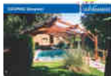
Habitat de loisirs 2%